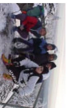
Gute Aussichten ?? Wir hoffen natürlich, dass wir auch im kommenden Winter solche Schneeverhältnisse vorfinden.

Achtung !! Skibasare !! Am ersten Wochenende im November finden die traditionellen Skibasare in Vellmar (14.11.) und Baunatal (06.11.?) statt. Dort kann man sich zu niedrigen Preisen mit sehr brauchbarem Skimaterial ausrüsten. Ein Muss für alle alpinen und nordischen Schnüppchenjäger !!!