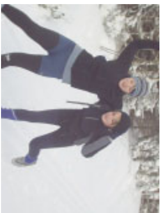
Vor lauter Begeisterung haut es einen schon mal um.

Achtung !! Skibasare !! Am ersten Wochenende im November finden die traditionellen Skibasare in Vellmar (14.11.) und Baunatal (06.11.?) statt. Dort kann man sich zu niedrigen Preisen mit sehr brauchbarem Skimaterial ausrüsten. Ein Muss für alle alpinen und nordischen Schnüppchenjäger !!!