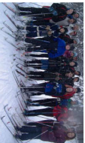
Hier sind nicht nur Schülerinnen und Schüler der Klassen 5-13 sondern auch noch ehemalige Schüler und Lehrer mit von der Partie.